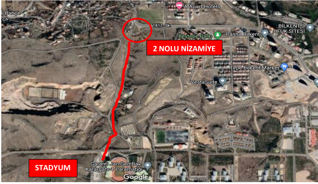
Stadyum Otopark Alanı